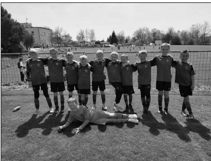
McDonald's Cup, kategorie mladší, okresní kolo, 5. místo