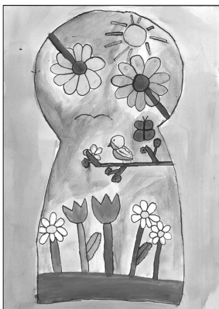
Ilustrace Anna Vlášková, 4. B