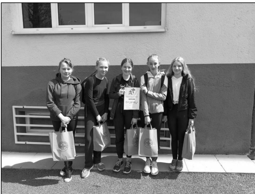
Mladý zdravotník, 2. stupeň, okresní kolo, 1. místo, krajské kolo 5. místo