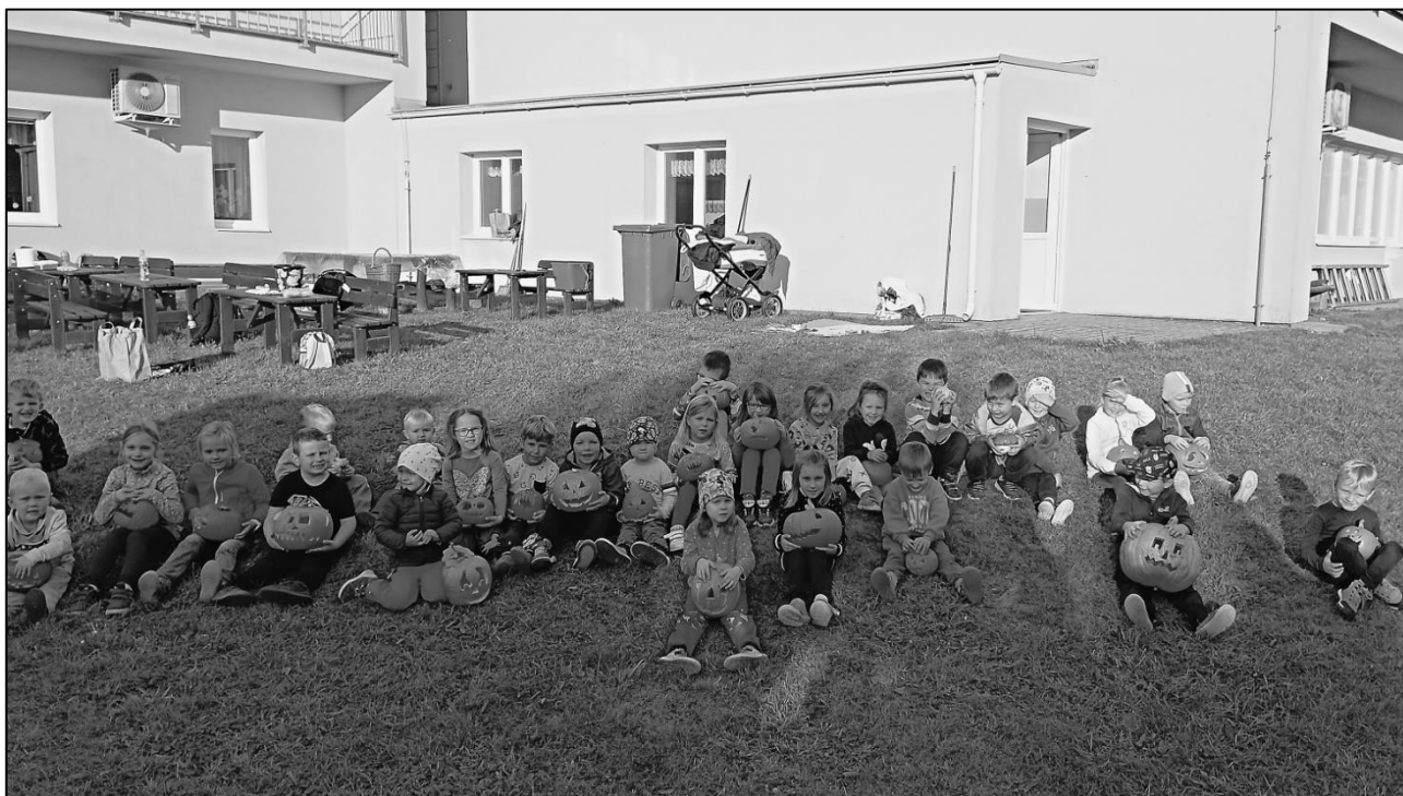
Dýňování a zamykání zahrady

Světýlkový průvod , datum a čas bude aktuálně upřesněn