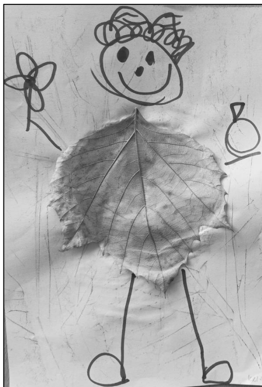
skřítek Podzimníček, třída Berušek

Děkujeme paní Šeredové za darované hračky pro děti do školky.